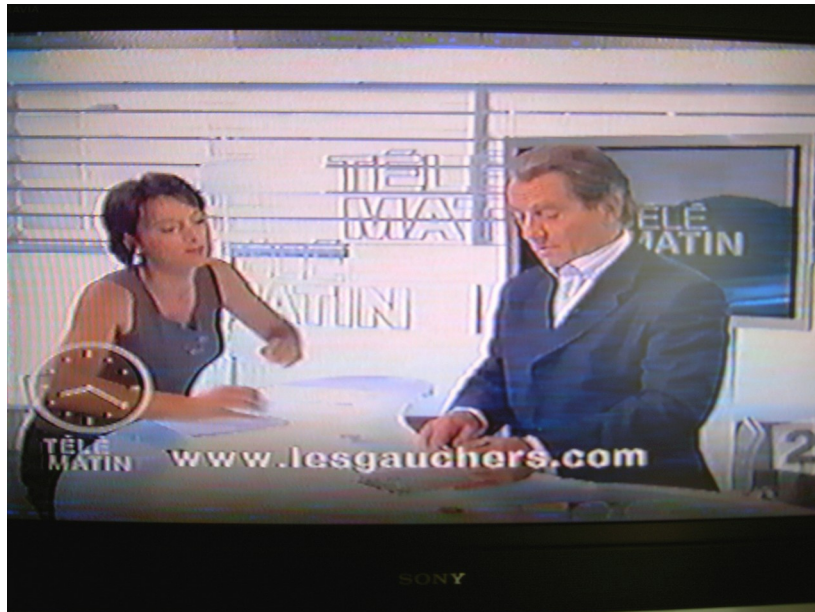
france 2 "Télématin" (septembre 2006 et 13 août 2007)