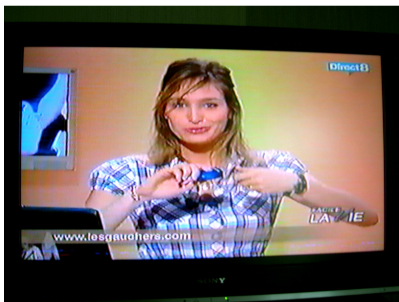
Direct8 "Facile la vie" (2008)