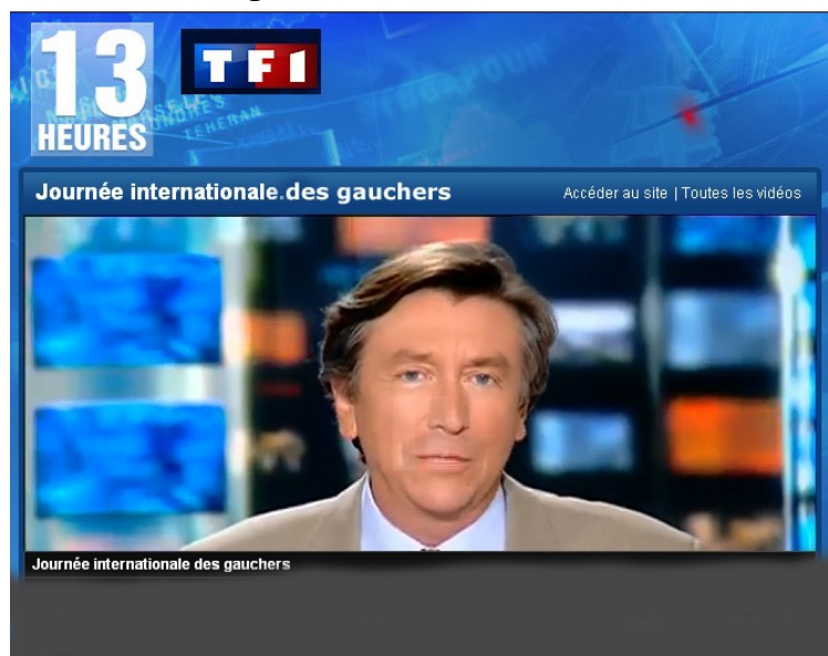
TF1 JT 13 H 11 08 2006