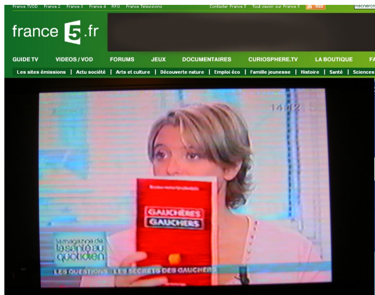
france 5 Magazine de la santé octobre 2005