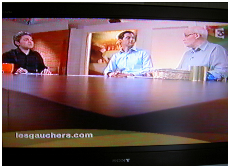
france 3 "C'est mieux le matin" (2007)