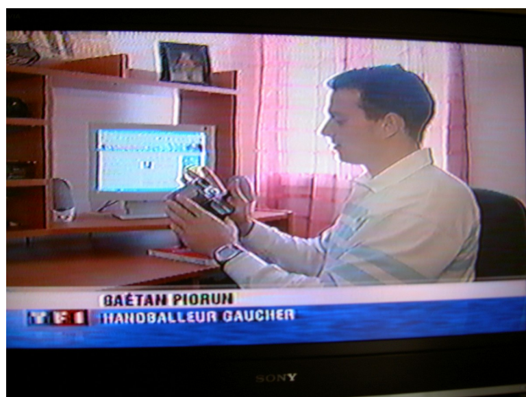
TF1 JT 20 H 2006